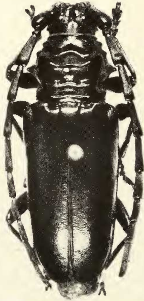
Abb. 1. Trachyderes steinhausenii spec. nov., Holotypus ♀.

Elytren gestreckt und konvex, mit geschlossenen Schulterbeulen, apikal schwach abgestutzt mit breit abgerundeten Winkeln, leicht lederartig verrunzelt und doppelt – äußerst fein und wenig dicht und etwas stärker und weitläufig – punktiert (bei 40 x). Die Punktierung bis zur Spitze deutlich. An den Rändern und im Apikalviertel äußerst fein, staubartig behaart.